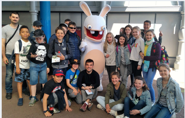
Futuroscope p 8