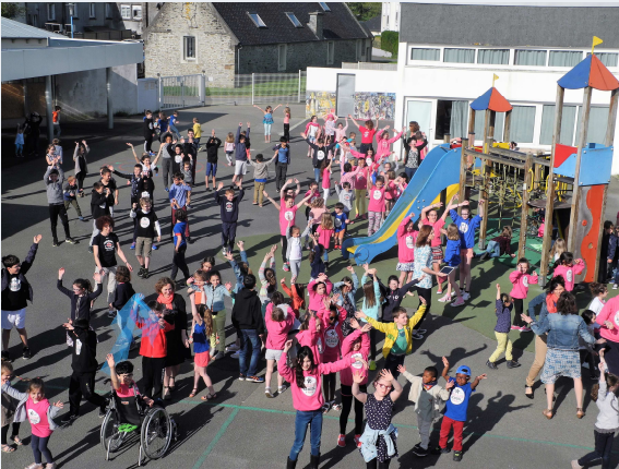
École publique p 5