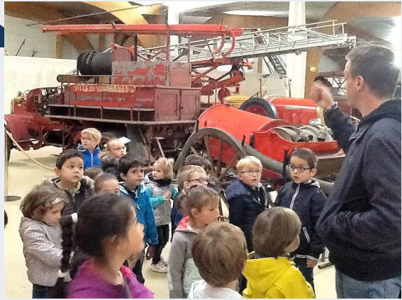
École Notre Dame de Lourdes p 5