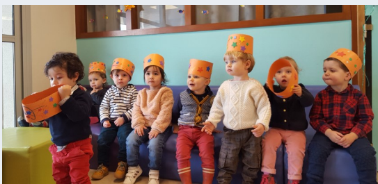
Les petits lutins p 8