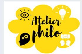
Les Feuillantines p 9