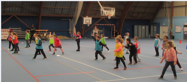
Notre dame de Lourdes p 5