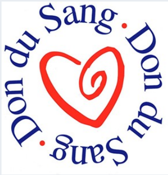
Don du sang le 4 avril p 3