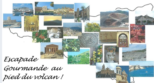
Comité jumelage Bohars– Sicile p 10