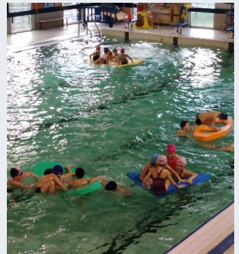
Notre dame de Lourdes p 5