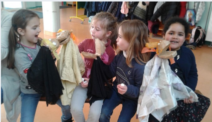
Ecole publique p 5