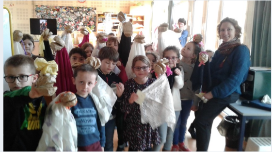
Ecole publique p 5